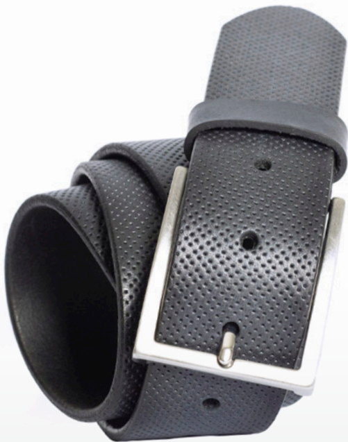
97 – schwarz

100% Leder offenkantig, mit Prägung, kürzbar, 4.0cm breit, Schliesse alt-silber, nickelfrei Bundweite 80 – 125cm