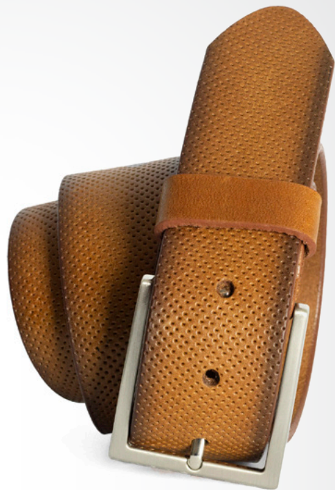
64 – cognac