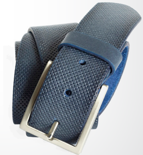
47 – blau