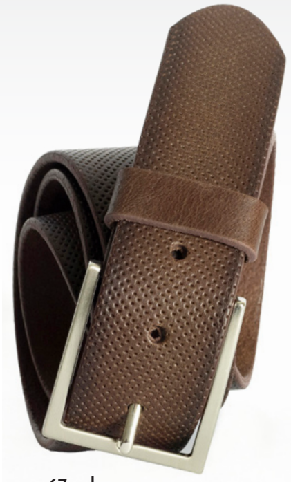
67 – braun